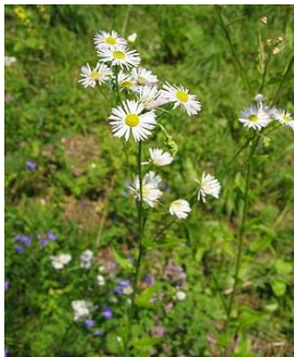
Einjähriges Berufkraut ( Erigeron annuus )

Sie sind sehr hübsch anzusehen, gehören aber nicht in unsere Wälder.