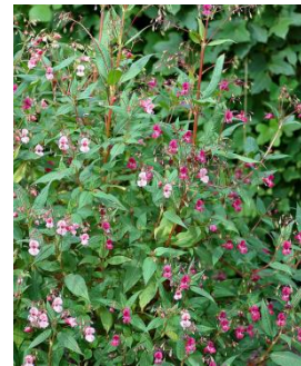
Drüsiges Springkraut ( Impatiens glandulifera )