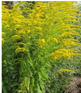
Kanadische Goldrute ( Solidago canadensis )